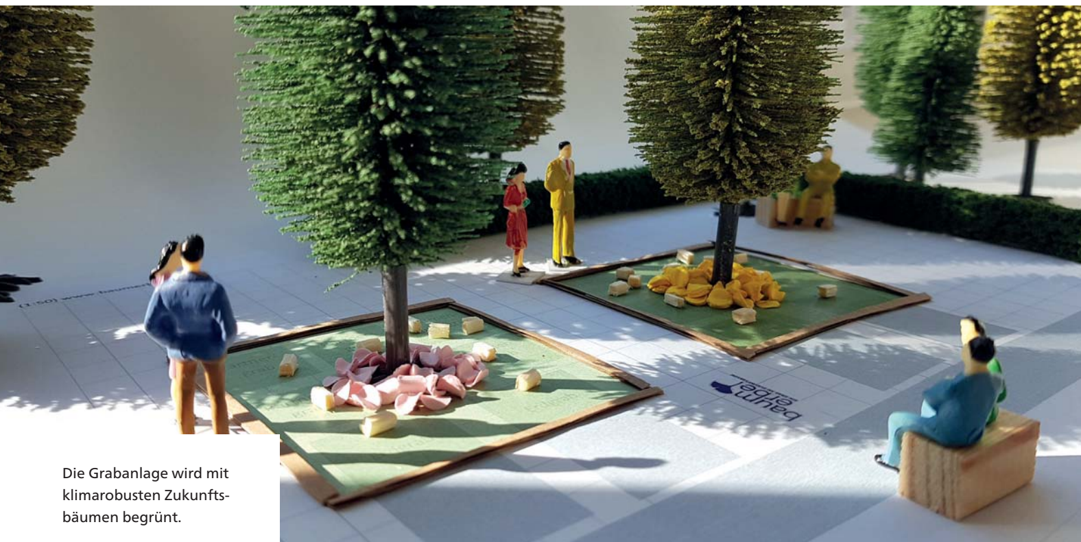
Die Grabanlage wird mit klimarobusten Zukunftsbäumen begrünt.